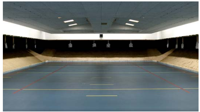
Abb. 3: 180 Grad Schießbahn

Bei Übungen, beginnend von der 3-6 m Schusszone am Ende des Raumes, bewegen sich die Schützen rückwärts in Richtung Einblaselemente und damit gegenläufig zur Luftströmung, so dass auch bei schnellen Bewegungen sichergestellt ist, dass sich alle in der Schießbahn befindlichen Personen