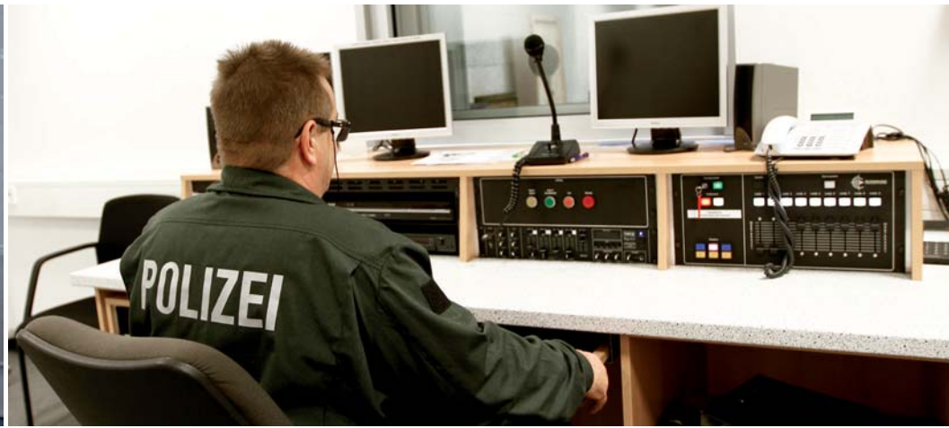
Abb. 1: Raumschießanlage der Polizei Düsseldorf