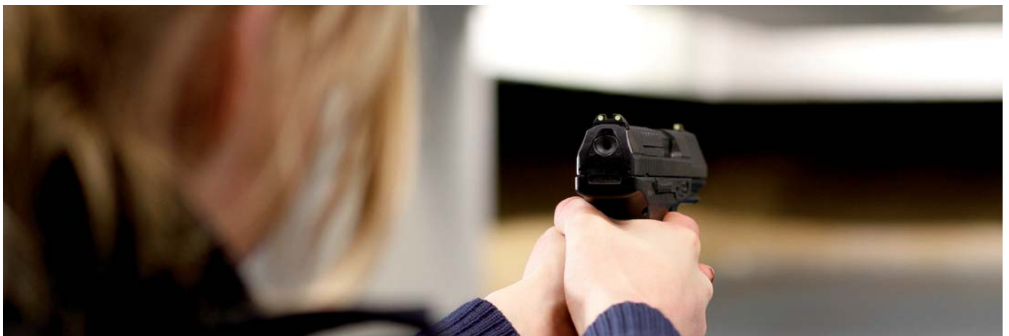
Abb. 2: Schussübungen in der Raumschießanlage

Verdrängungslüftungen von Strulik sind in allen Anforderungen und zu erfüllenden Kriterien optimal und individuell auf die Raumschießanlagen und/oder teilgedeckten Anlagen abgestimmt.